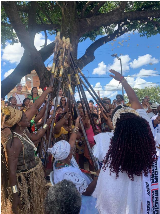
Figura 3: Apresentação do Bloco Afro Magia Negra durante o carnaval no bairro da Concórdia.

expressões culturais de matriz africana. Nesse sentido, reconhecemos uma complementaridade entre os processos dos Estados Unidos e do Brasil. Reunir essas histórias fortalece nossa conexão enquanto irmãos e irmãs em diáspora e abre possibilidades de troca, solidariedade e resistência contra as forças hegemônicas — apesar das diferenças sociais, políticas e econômicas nas quais estamos inseridos.