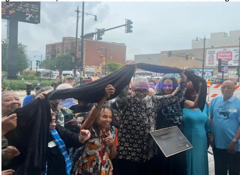
Figura 4: Ex-líderes dos Panteras Negras inauguram uma placa na sede, agora demolida, da filial de Illinois do Partido dos Panteras Negras.