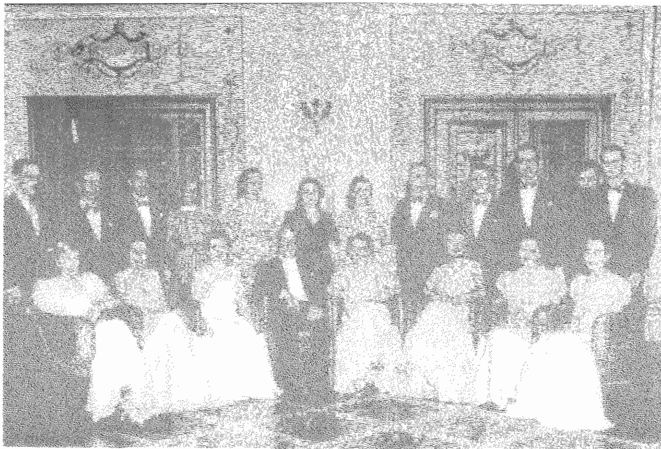
Formandos da 3a. Turma Salão do Teatro Municipal. São Paulo - SP, 1938 ACRÔNIO CARPFFELCH - USP