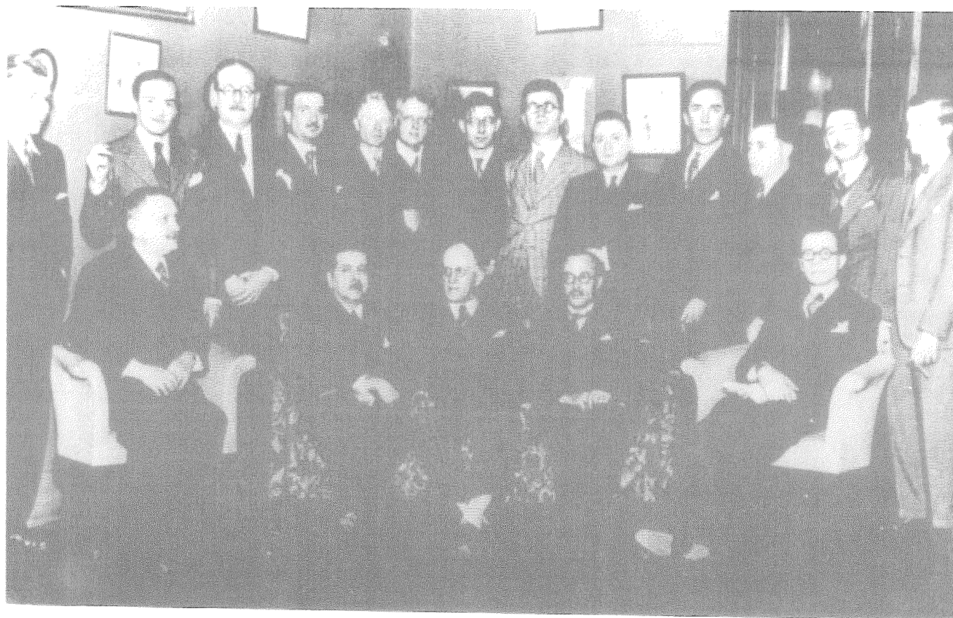
Missão Francesa - Professores franceses reúnem-se para comemorar a fundação da Universidade de São Paulo. São Paulo – SP, 1934