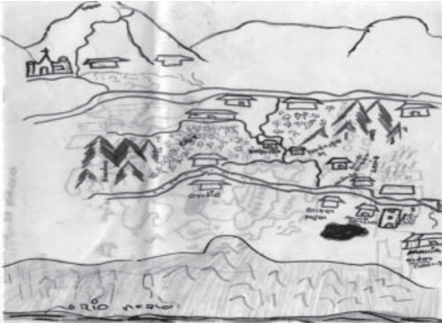
Imagen N° 3. Mapa Individual