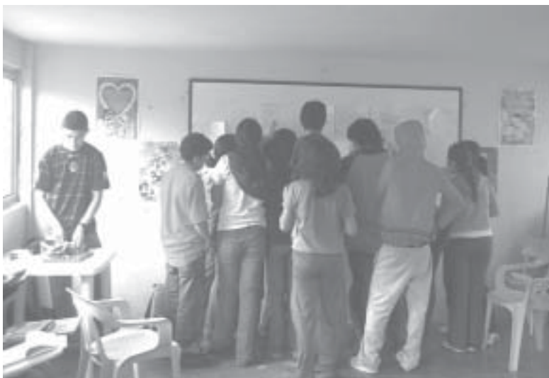
Imagen N° 2. Ejercicio de Cartografía Social

• Podremos tener varios "mapas" de nuestro territorio, tanto del presente como del pasado y del futuro que deseamos.