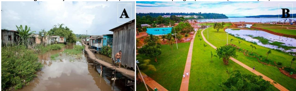
Figura 3: Projeto de Intervenções para Altamira – Parque Igarapé Altamira (Antes e Depois)