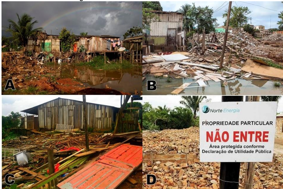
Figura 4: Casas Demolidas nos Baixões de Altamira