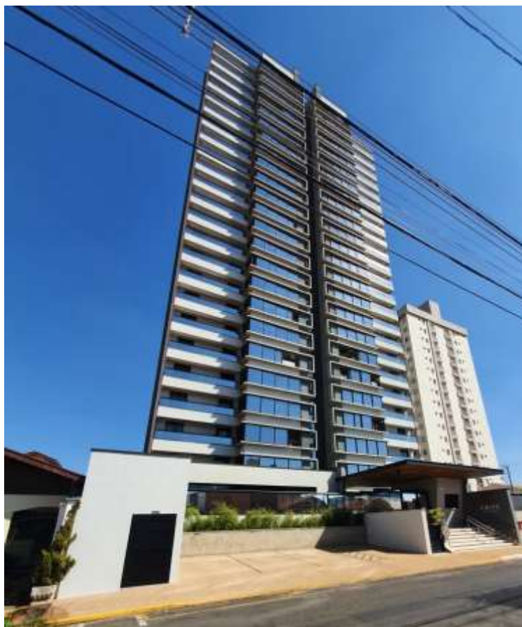
Figura 2: Empreendimento residencial inaugurado recentemente no bairro São Dimas – Piracicaba.

O empreendimento residencial localizado na rua Doutor Paulo Pinto (Figura 2) faz parte da área na qual está concentrado as propostas de transformação em corredor comercial, inclusive foram enviadas propostas para transformar a rua em um corredor comercial. As transformações ocorridas nessa área apresentam uma dinâmica de reestruturação urbana por meio de processos de verticalização, requalificação urbana, mudança no uso do solo e especulação imobiliária, o que é reafirmado pela tipologia de propostas apresentadas, ou seja, propostas de caráter de reestruturação do uso do espaço urbano. Arelado ao mercado imobiliário, a área está passando por um processo ainda maior de valorização o que reflete nos preços dos imóveis, podendo chegar a cerca de um milhão de reais por apartamento, tal como o do empreendimento mostrado na Figura 2.