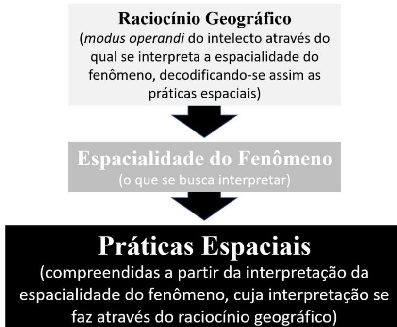
Figura 2: Processo de retroalimentação inerente ao Raciocínio Geográfico, a Espacialidade do Fenômeno e as Práticas Espaciais.

Diante dessa retroalimentação é que se desvelam as Práticas Espaciais (SOUZA, 2013). O Raciocínio Geográfico constitui então o modus operandi do intelecto fundamental para a compreensão da espacialidade do fenômeno e da decodificação das Práticas Espaciais (SOUZA, 2013), objeto da Geografia. A Figura 2 ilustra tal ideia.