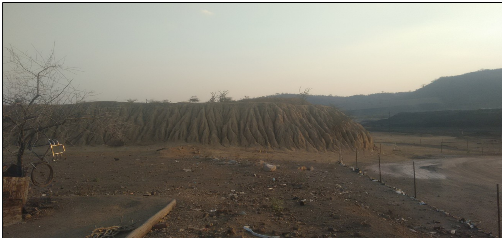
Foto 10. Pilha de estéreis ao redor da Mina Moatize Ltda. em Moatize.

Um dos mais característicos impactos causados pela atividade mineira na região de estudo é a degradação acentuada da paisagem. Na mineração a céu aberto, a paisagem é destruída e descaracterizada devido à escavação superficial e profunda para a abertura de cavas. Dessa operação são visíveis pilhas de até 20 metros de altura de estéreis, dispostas ao longo da área minerada.