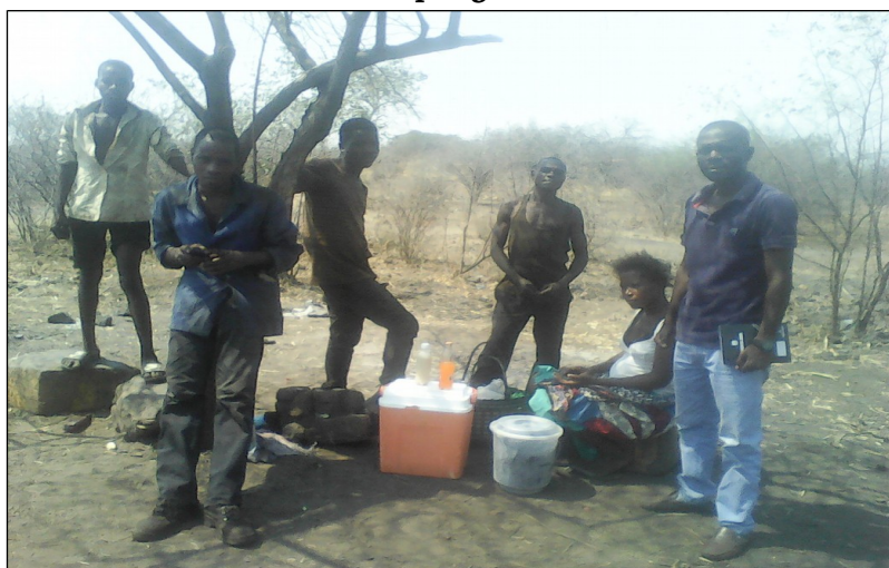
Foto 5. Vendedeira expando seus produtos aos artesanais na mina de Chipanga 7.

A situação observada no local é bastante complexa, pois contemplamos diretamente a queima da jazida no próprio local, facto que deixa a desejar os utentes e visitantes daquela região. É imperioso destacar ainda que o extrativismo mineiro contribui, embora sob forma artesanal na região de estudo, direta ou indiretamente para a geração de renda por parte da comunidade local, na medida em que esta atividade tem colocado seus produtos (venda) aos agentes artesanais, assim como aos compradores do carvão produtos estes de género alimentares notadamente: refrigerantes, sumos, pães e outros de carácter análogos (foto 5).